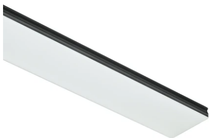
500 mm opal diffuser. Diffuse, glare free and uniform lighting throughout the room 08.0111.00