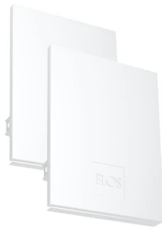
Metal cover. Suspension Up & Down. 100 mm (Colour Anodized Grey) 08.9058.02