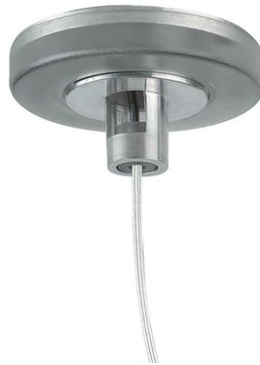
Power supply rose. Dali 08.0031.00.DA