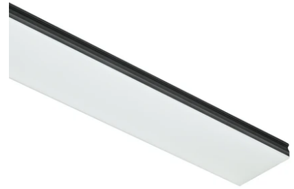
500 mm opal diffuser. Diffuse, glare free and uniform lighting throughout the room 08.0111.00