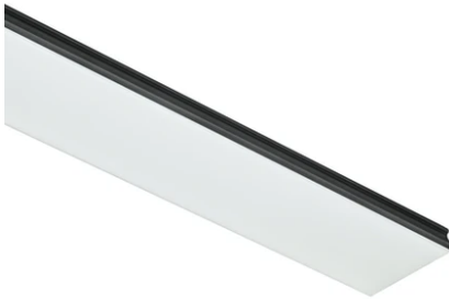
500 mm opal diffuser. Diffuse, glare free and uniform lighting throughout the room 08.0111.00