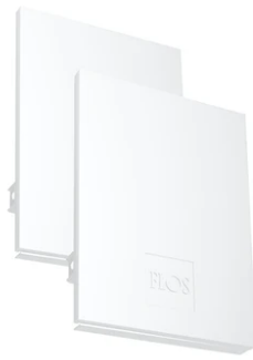
Metal cover. Suspension Up & Down. 100 mm 08.9058.06