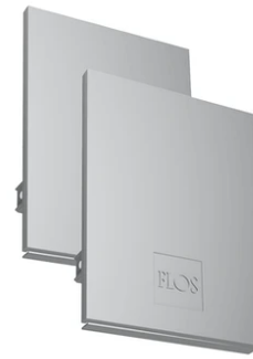
Metal cover. Suspension Up & Down. 100 mm (Colour White) 08.9058.40