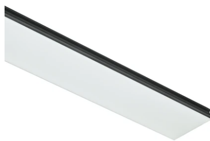
500 mm opal diffuser. Diffuse, glare free and uniform lighting throughout the room 08.0111.00