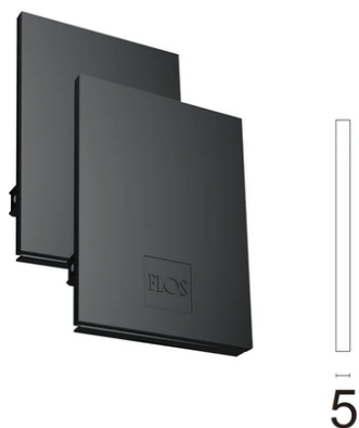
Metal cover. Suspension Up & Down. 100 mm (Colour Black) 08.9058.NS