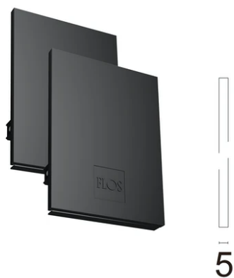
Metal cover. Suspension Up & Down. 100 mm 08.9058.06