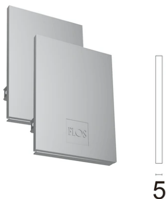
Metal cover. Suspension Up & Down. 100 mm (Colour Anodized Grey) 08.9058.02