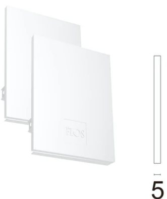
Metal cover. Suspension Up & Down. 100 mm (Colour White) 08.9058.40