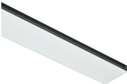
500 mm opal diffuser. Diffuse, glare free and uniform lighting throughout the room 08.0111.00