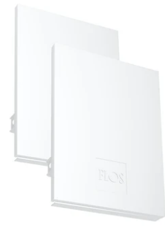
Metal cover. Suspension Up & Down. 100 mm (Colour Anodized Grey) 08.9058.02