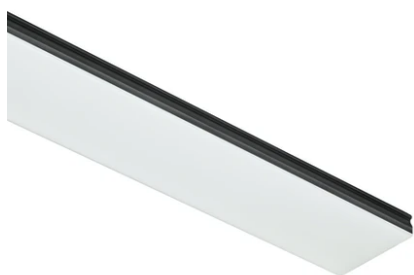
500 mm opal diffuser. Diffuse, glare free and uniform lighting throughout the room 08.0111.00