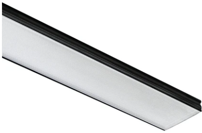
500 mm micro-prismatic diffuser. Highly efficient multilayer diffuser that, thanks to its unique microprismatic texture, provides a glare free UGR<19 light beam 08.0114.00