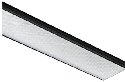
500 mm micro-prismatic diffuser. Highly efficient multilayer diffuser that, thanks to its unique microprismatic texture, provides a glare free UGR<19 light beam 08.0114.00