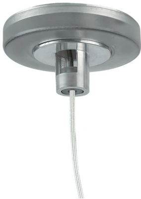
Power supply rose. Dali 08.0031.00.DA