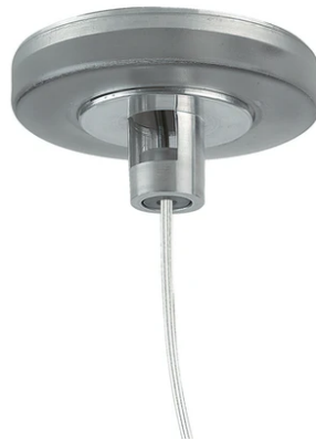
Power supply rose. Dali 08.0031.00.DA