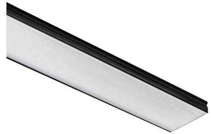
500 mm micro-prismatic diffuser. Highly efficient multilayer diffuser that, thanks to its unique microprismatic texture, provides a glare free UGR<19 light beam 08.0114.00