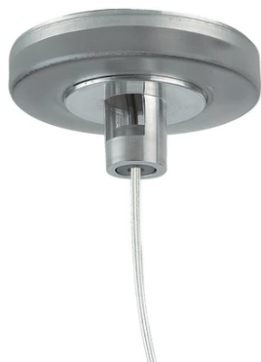
Power supply rose. Dali 08.0031.00.DA