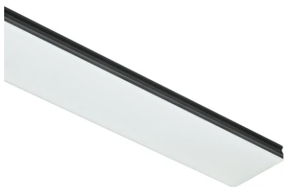
500 mm opal diffuser. Diffuse, glare free and uniform lighting throughout the room 08.0111.00