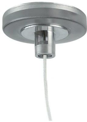
Power supply rose. Dali 08.0031.00.DA