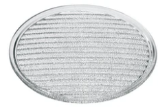
Elliptical Lens 08.9109.00