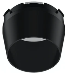
Snoot Shielding Cone 08.9111.00