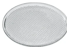
Flood Lens 08.9110.00