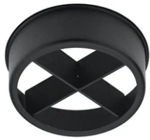
Screening Crosspiece 08.9108.00