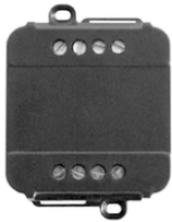
0/1-10V & Push 12-48V Dimmer 60.9395