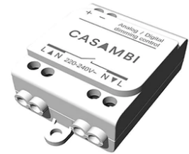
Casambi Controller 220-240V. Remote Installation 60.9392