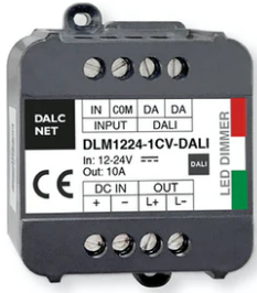
DALI 12-48V Dimmer 60.9678