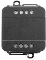
0/1-10V & Push 12-48V Dimmer 60.9395