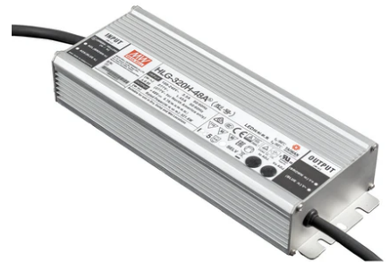
LED Power Supply Source for remote installation. 48V/320W. 100/240 Vac 60.8919