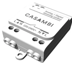
Casambi Controller 220-240V. Remote Installation 60.9392