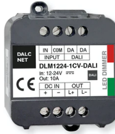
DALI 12-48V Dimmer 60.9678