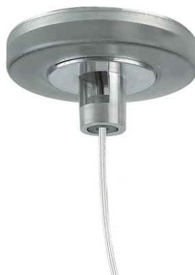
Power supply rose 08.0031.00