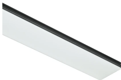
500 mm opal diffuser. Diffuse, glare free and uniform lighting throughout the room 08.0111.00