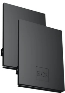
Metal cover. Suspension Up & Down. 100 mm 08.9058.06