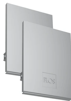
Metal cover. Suspension Up & Down. 100 mm (Colour Anodized Grey) 08.9058.02