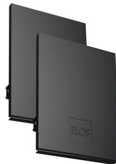
Metal cover. Suspension Up & Down. 100 mm (Colour Black) 08.9058.NS