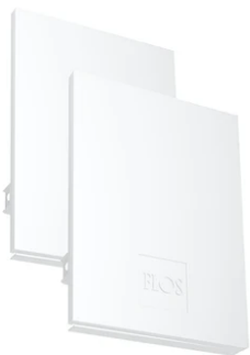
Metal cover. Suspension Up & Down. 100 mm (Colour White) 08.9058.40