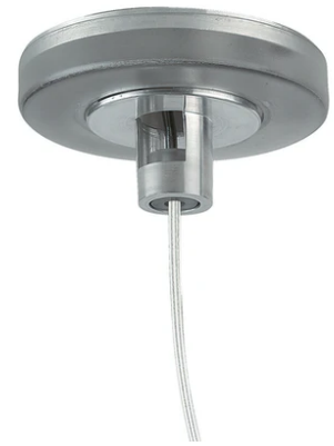
Metal cover. Suspension Up & Down. 100 mm 08.9058.06