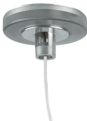
Power supply rose. Dali 08.0031.00.DA