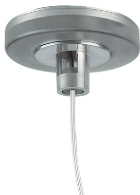
Power supply rose. Dali 08.0031.00.DA