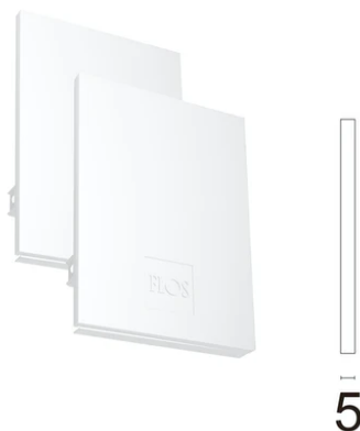
Metal cover. Suspension Up & Down. 100 mm (Colour White) 08.9058.40