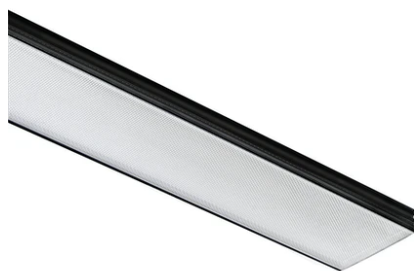
500 mm micro-prismatic diffuser. Highly efficient multilayer diffuser that, thanks to its unique microprismatic texture, provides a glare free UGR<19 light beam 08.0114.00