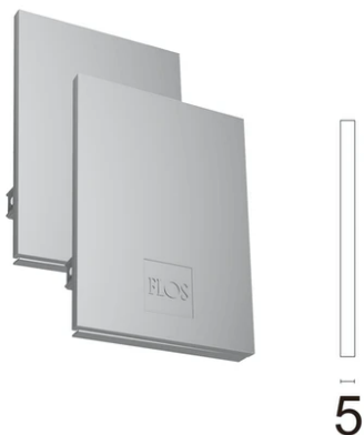
Metal cover. Suspension Up & Down. 100 mm (Colour Anodized Grey) 08.9058.02