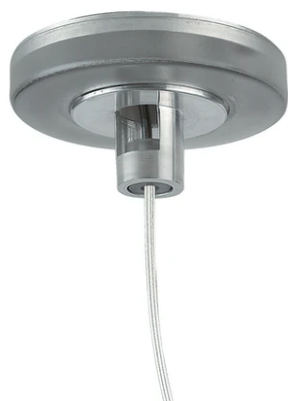
Power supply rose 08.0031.00