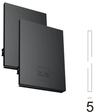
Metal cover. Suspension Up & Down. 100 mm