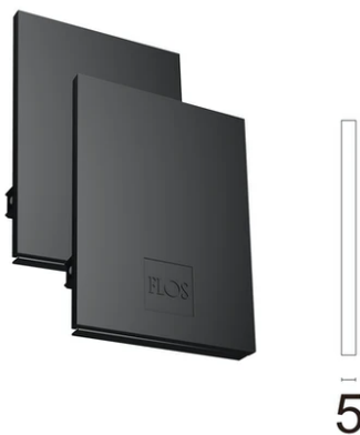
Metal cover. Suspension Up & Down. 100 mm (Colour Black) 08.9058.NS