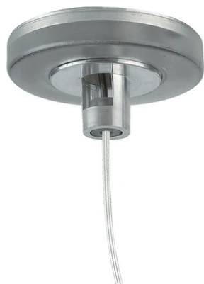
Power supply rose 08.0031.00