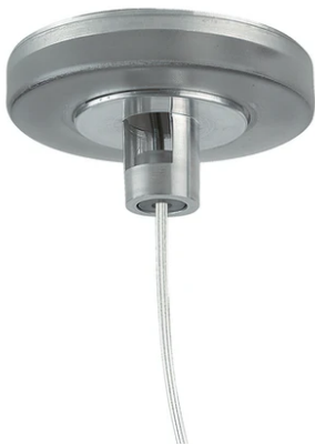
Power supply rose 08.0031.00