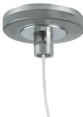
Power supply rose 08.0031.00