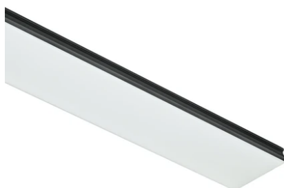
500 mm opal diffuser. Diffuse, glare free and uniform lighting throughout the room 08.0111.00