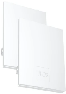
Metal cover. Suspension Up & Down. 100 mm (Colour Anodized Grey) 08.9058.02