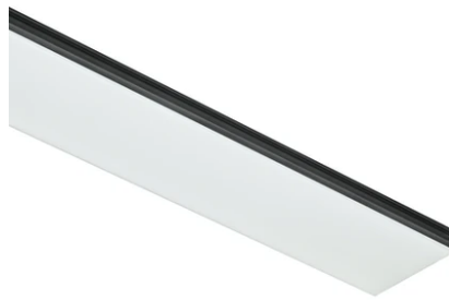
500 mm opal diffuser. Diffuse, glare free and uniform lighting throughout the room 08.0111.00