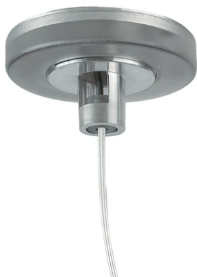
Power supply rose 08.0031.00