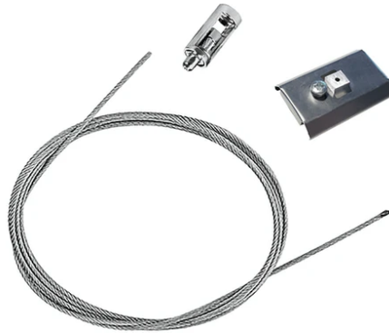
Suspension kit 08.0030