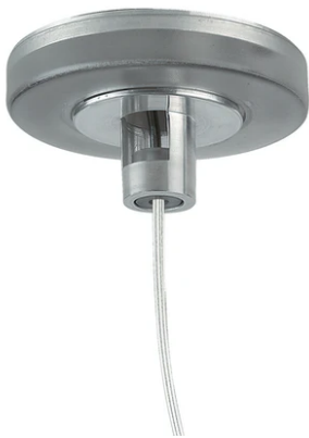
Power supply rose. Dali 08.0031.00.DA