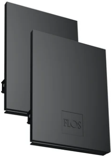
Metal cover. Suspension Up & Down. 100 mm 08.9058.06