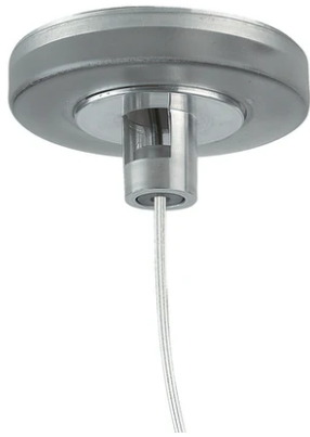
Power supply rose. Dali 08.0031.00.DA