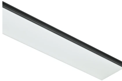
500 mm opal diffuser. Diffuse, glare free and uniform lighting throughout the room 08.0111.00