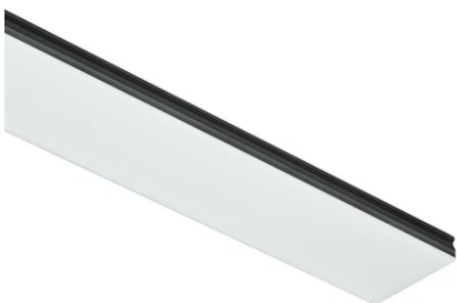
500 mm opal diffuser. Diffuse, glare free and uniform lighting throughout the room 08.0111.00