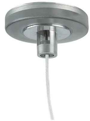
Power supply rose. Dali 08.0031.00.DA