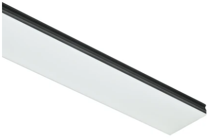
500 mm opal diffuser. Diffuse, glare free and uniform lighting throughout the room 08.0111.00