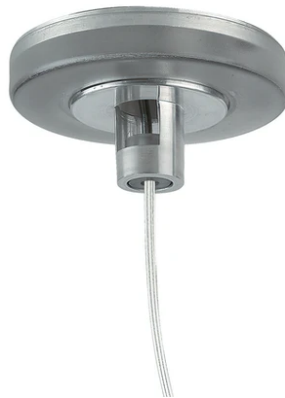
Power supply rose. Dali 08.0031.00.DA