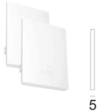
Metal End Cap. Recessed No Trim / Surface / Suspension Down. 100 mm (Colour White) 08.9054.40