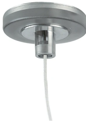
Power supply rose 08.0031.00