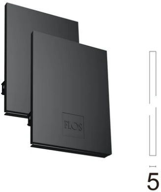
Metal cover. Surface / Suspension Down. 100 mm 08.9054.06