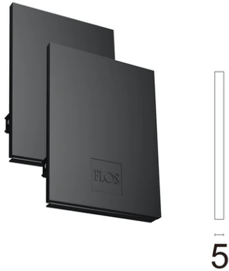
Metal End Cap. Recessed No Trim / Surface / Suspension Down. 100 mm (Colour Black) 08.9054.NS