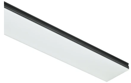
500 mm opal diffuser. Diffuse, glare free and uniform lighting throughout the room 08.0111.00