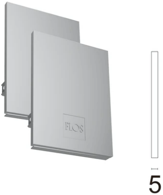
Metal End Cap. Recessed No Trim / Surface / Suspension Down. 100 mm (Colour Anodized Grey) 08.9054.02