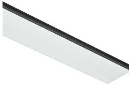
500 mm opal diffuser. Diffuse, glare free and uniform lighting throughout the room 08.0111.00