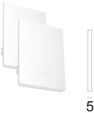
Metal End Cap. Recessed No Trim / Surface / Suspension Down. 100 mm (Colour White) 08.9054.40