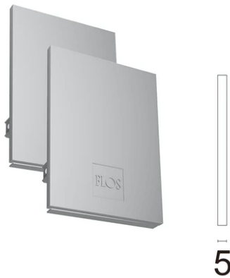
Metal End Cap. Recessed No Trim / Surface / Suspension Down. 100 mm (Colour Anodized Grey) 08.9054.02