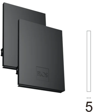
Metal End Cap. Recessed No Trim / Surface / Suspension Down. 100 mm (Colour Black) 08.9054.03