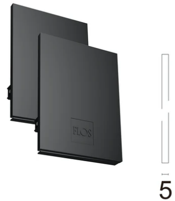
Metal cover. Surface / Suspension Down. 100 mm 08.9054.06