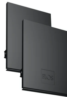
Metal cover. Surface / Suspension Down. 100 mm 08.9054.06