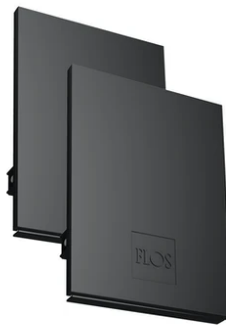
Metal End Cap. Recessed No Trim / Surface / Suspension Down. 100 mm (Colour Anodized Grey) 08.9054.02