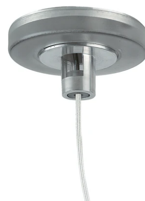
Power supply rose. Dali 08.0031.00.DA