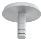
Feed recessed joint rose. 24V. 06.5306.40