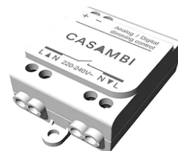
Casambi Controller 220-240V. Remote Installation 60.9392