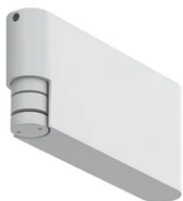
Surface feed box for ceiling installation. 24V. Driver included CASAMBI / 57W 06.5313.40