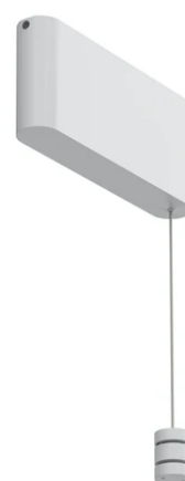
Suspension feed box for surface installation. 24V. Driver included Casambi / 57W 06.5311.40