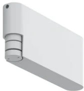
Surface feed box for ceiling installation. 24V. Driver included DALI / 57W 06.5315.40