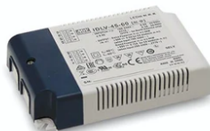
24V Remote power supply. Dimmable through 1/10V protocol or Non Dimmable. 57W 220/240V 60.9361