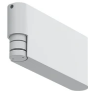
Surface feed box for ceiling installation. 24V. Driver included 1-10V / 57W 06.5312.40