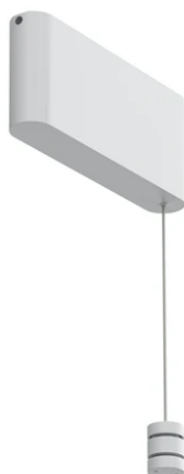
Suspension feed box for surface installation. 24V. Driver included 1-10V / 57W 06.5310.40