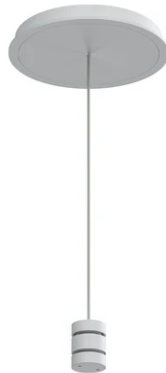
Feed suspension joint with rose for recessing. 24V 06.5302.40