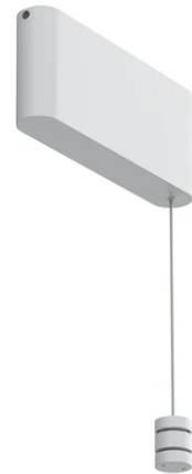
Suspension feed box for surface installation. 24V. Driver included DALI / 57W 06.5314.40