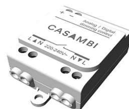
Casambi Controller 220-240V. Remote Installation 60.9392