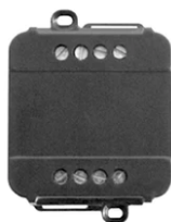
0/1-10V & Push 12-48V Dimmer 60.9395