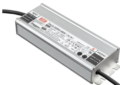
LED Power Supply Source for remote installation. 48V/320W. 100/240 Vac 60.8919