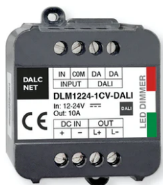
DALI 12-48V Dimmer 60.9678