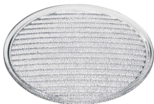
Elliptical lens 08.8418.68A