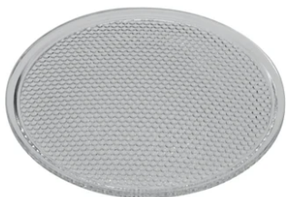
Flood lens 08.0050.00