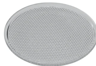
Flood lens 08.0050.00