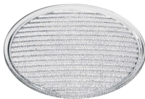
Elliptical lens 08.8418.68A