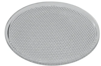
Elliptical lens 08.8418.68A