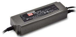
24V Remote power supply. Dimmable through DALI protocol. 120W 110/240V 60.9426