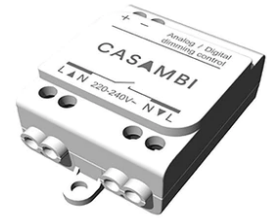
Casambi Controller 220-240V. Remote Installation 60.9392