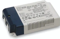
24V Remote power supply. Dimmable through 1/10V protocol or Non Dimmable. 57W 220/240V 60.9361